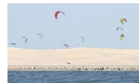
Vogels zoeken vaak een rustige plek op en storen zich niet aan de vele kitesurfers even verderop. Het aantal kitesurfers is de afgelopen vier jaar gestegen. 6