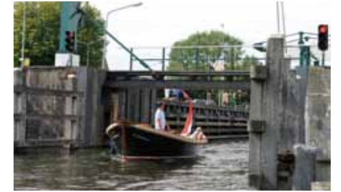
Het Hemeltje is één van de sluisen richting de Loosdrechtse Plassen.