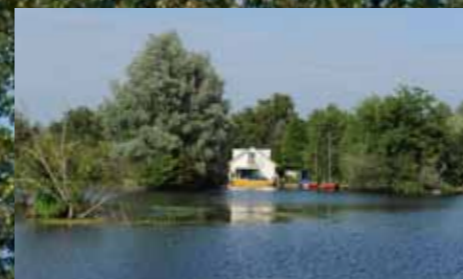
De Baambrugse Zuwe is een bijzondere plek om te vertoeven aan het water.