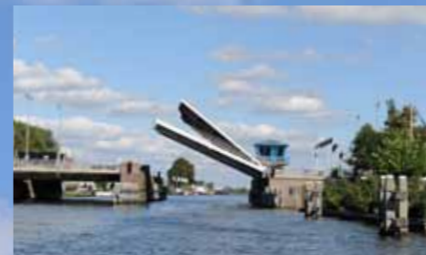
De Leimuiderbrug is een markant onderdeel van de Ringvaart.