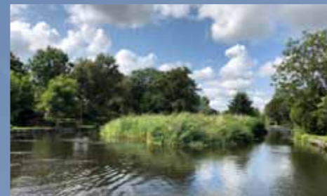
De Drecht is een doorvaart in de prachtige Bovenlanden.