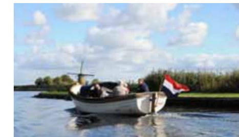
Rond de Kagerplassen ervaar je het pure Hollandse landschap met molens.