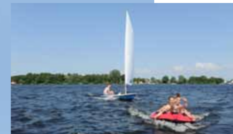
Zeilen of funsport; voor iedereen is er plek op de veelzijdige Kagerplassen.