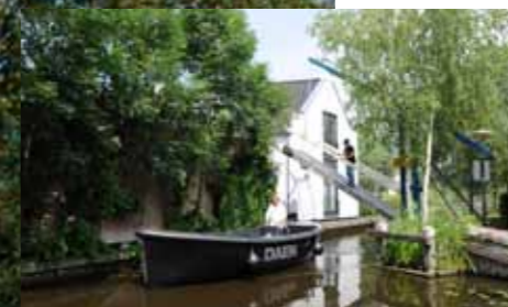
Op de Geuzenbrug in Vinkeveen is dit een bijzondere brugwachter.