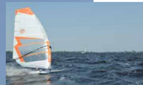
Windsurfer bij recreatie eiland Vrouwentroost op de Grote Poel.