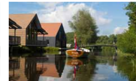
Het bekende vakantiepark van Landal aan de Reeuwijkse Plassen.