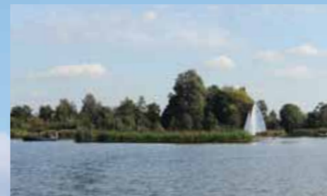
Het is ontspannen varen en zeilen in deze ongedwongen omgeving.