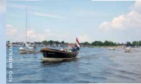
De Loosdrechtse Plassen zijn vooral in de zomer gezellig druk.