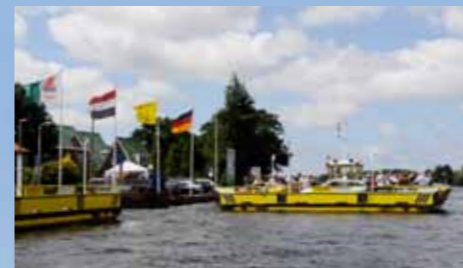
Het pontje naar Kaageiland brengt je naar een 'andere' wereld.