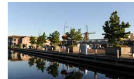
De Dorpshaven van Aalsmeer, midden in het gezellige centrum.