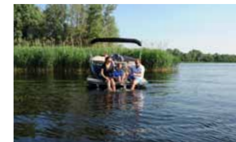
Even aanleggen in het riet om te zwemmen met de familie.