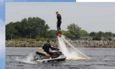
Flyboarden is een extreme watersport die je op Vlietland kunt leren.