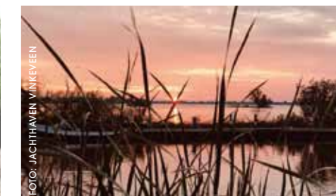
Romantische zonsopgang bij Jachthaven Vinkeveen.