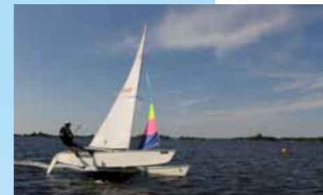
Zeilers laten de wind haar werk doen op het Braassemermeer.