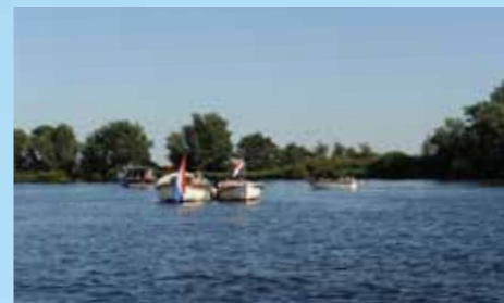
Dobberen en lekker zwemmen in het Braassemermeer is populair.