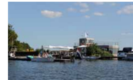
Op de Hemmen kun je met een hapje en drankje heerlijk genieten.