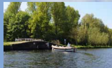
Vanaf het Rijn-Schiekanaal (de Vliet) kun je Vlietland makkelijk bereiken.