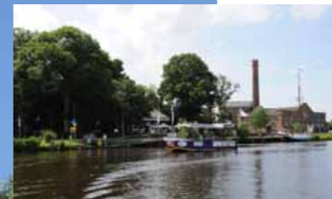
Gemaal De Cruquius met het bekende theehuis en museum.