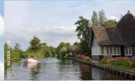
De bekendste straat van Loosdrecht en Amsterdam; de Kalverstraat.