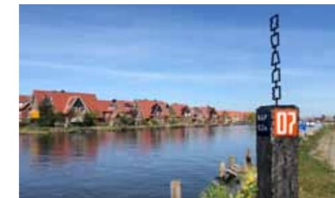
Bij Hillegom/Beinsdorp was het startpunt voor het graven van de Ringvaart.

Welkom op de Ringvaart van de Haarlemmermeerpolder