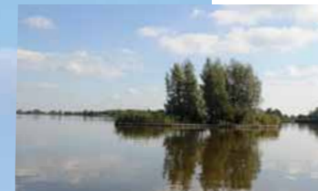
De Reeuwijkse Plassen hebben een oer-Hollands veenlandschap.